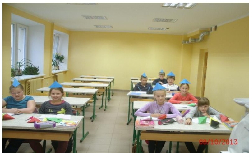
Foto no stundas.

Galvenais ir nesteigties, ar pārliecību veidot pamatus izpratnei par pārsapņiem.